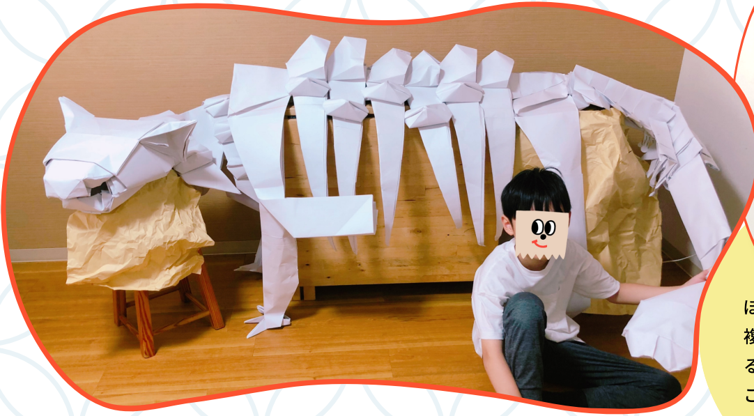
※こちらは実際の三分の一の試作品です。約3.4m